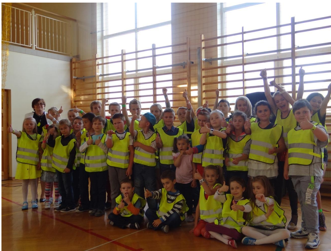
Uczniowie Szkoły Podstawowej w Zborowicach w kamizelkach odblaskowych